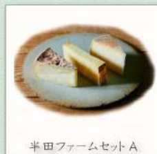
半田ファームセット A