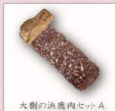
大樹の浜鹿肉セット A