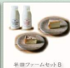
半田ファームセット B