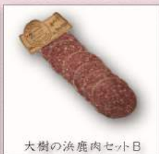
大樹の浜鹿肉セット B